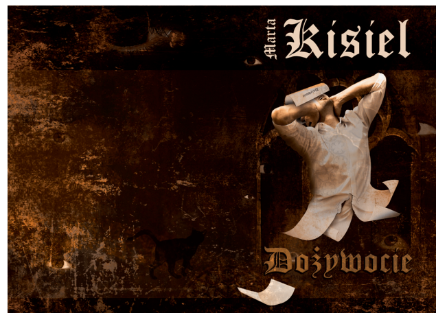
Z prac Studia - okładka książki.

Z pasji twórczej właścicielki powstała baza niepowtarzalnych projektów graficznych, które pozwoliły wydzielić trzeci dział – grafikę dekoracyjną. Są to przede wszystkim projekty przystosowane do dekorowania wnętrz, które odpowiednio przetworzone staną się szablonami malarskimi lub naklejkami ściennymi. Kolekcja tych grafik systematycznie jest powiększana wypełniając lukę w ofercie rynkowej o niepowtarzalne, artystyczne rozwiązania. Ostatni z działów firmy jest odpowiedzialny za techniczne wykonanie i sprzedaż za pośrednictwem internetu produktów opracowanych na bazie grafiki dekoracyjnej.